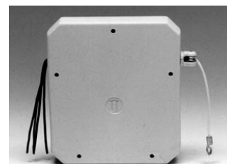
dimensioni mm 103x100x16 lunghezza fune cm 280 carrucola orientabile

Si raccomanda di limitare il numero di sensori per evitare allarmi impropri, provocati da impulsi occasionali che potrebbero essere generati da diversi sensori a breve distanza di tempo.