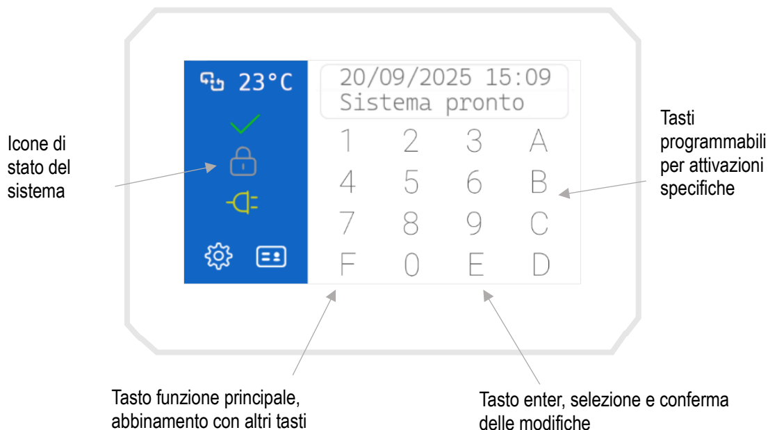
Figura 1 La tastiera tacto K43E

Su due righe è possibile visualizzare le informazioni di sistema e scorrere i menù. Quando il sistema si trova a riposo il display riporta la data e l'ora seguite dall'indicazione Sistema Pronto come esemplificato in figura. In qualunque momento è possibile interrogare il sistema premendo il tasto F ed un altro tasto (pressione contemporanea su tastiere TELEPAD K32 ).