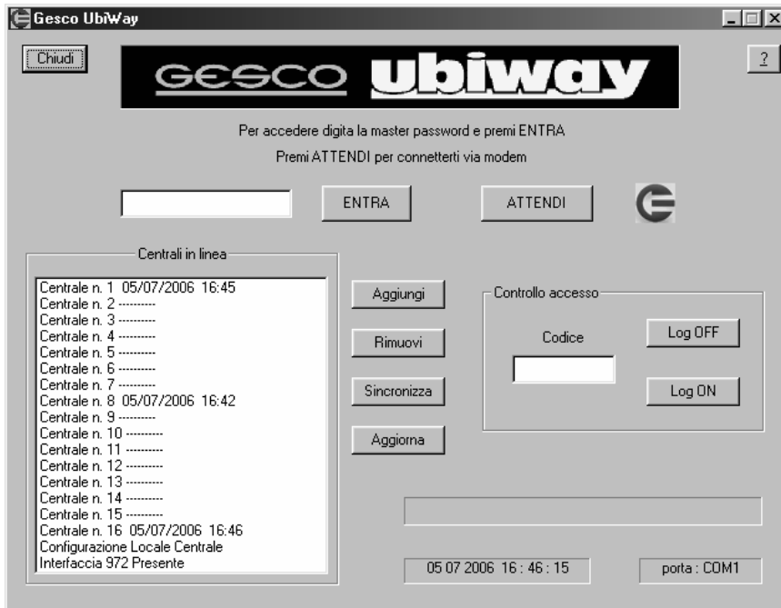
Figura 2 La pagina principale di UbiWay

Il programma UbiWay viene fornito senza la master password. Qualora si desideri una password per utilizzare il programma, editare il file confge.ini , scrivere sulla riga 6 la password desiderata al posto di --, salvare il file ed uscire, aprire UbiWay , inserire la master password e cliccare sul pulsante [ENTRA].